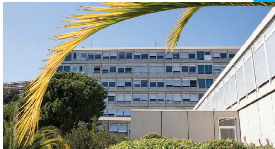
Site de Nice Fabron