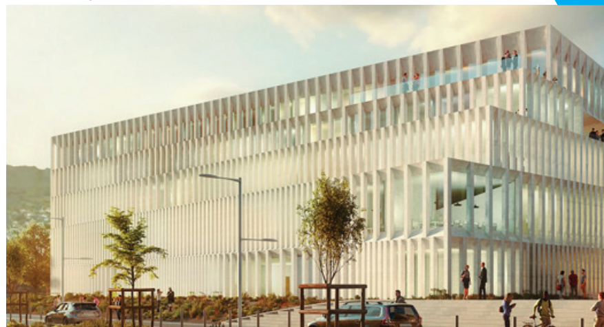
Futur campus cannois