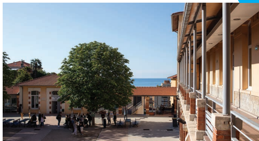
Site de Menton