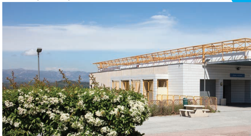
Site de Sophia Antipolis