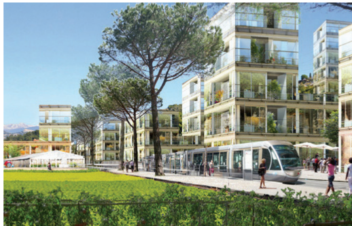
Projet Éco-Vallée, Nice Ouest